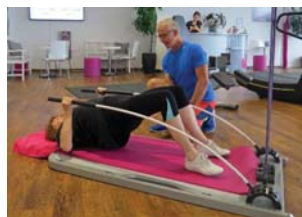
Stix unterstützen in der Schulterbrücke