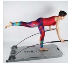
stabile Stix unterstützen, flexible erfordern Koordination