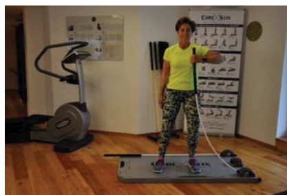
Auch bei einfachen Übungen spannen Core und Beckenboden automatisch an