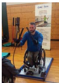
Spezialboard f. Rollstuhlfahrer